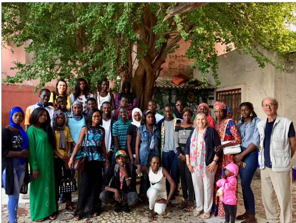
Saint-Louis (Sénégal) novembre 2019 rencontre avec nos bénéficiaires

Rue Pradier 8 CH-1201 Genève Tél. +41 (0)78 762 24 38 / (0)76 589 07 70 www.afps.ch info@afps.ch CCP 14-542951-3 IBAN CH71 0900 0000 1454 2951 3